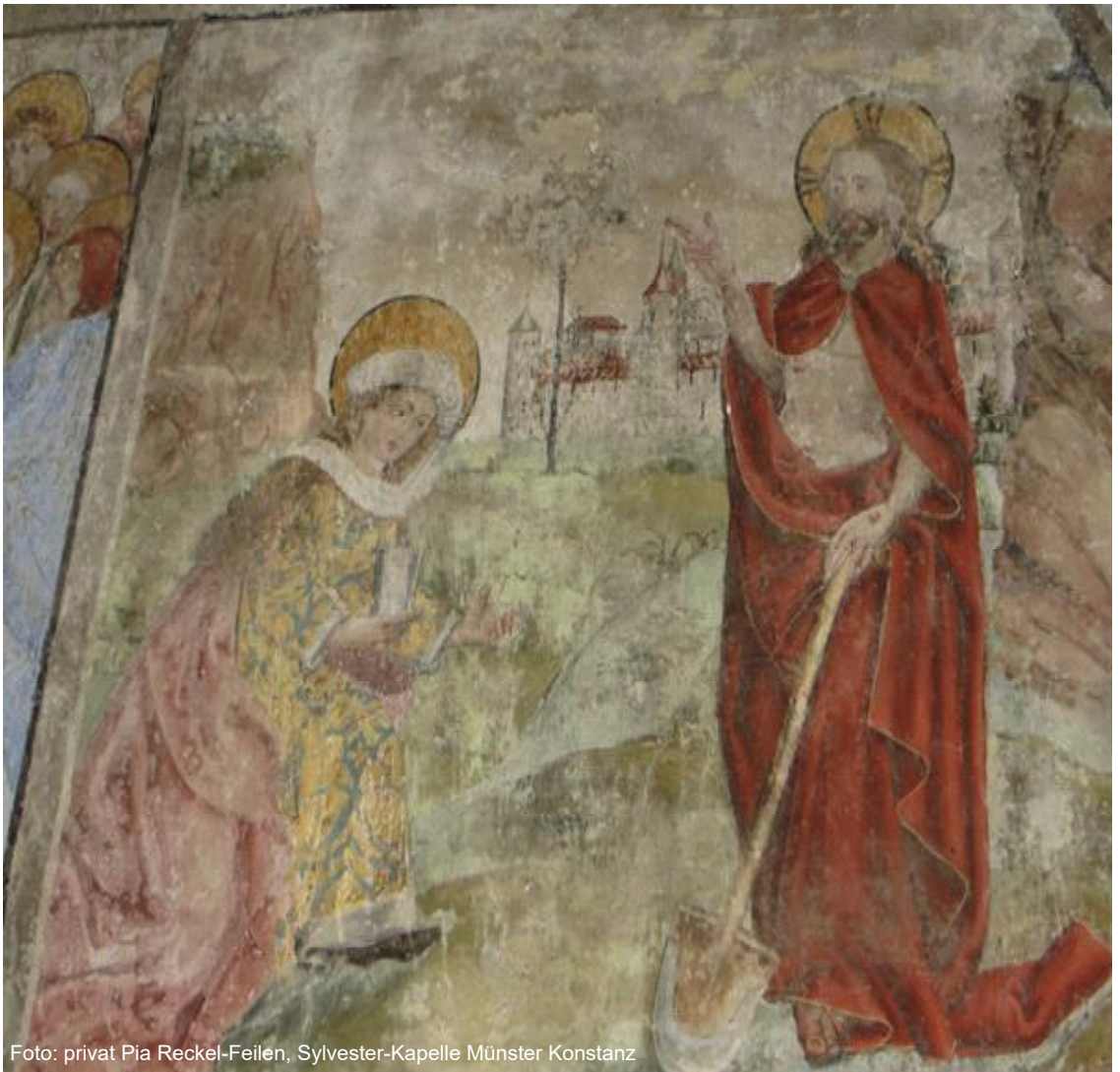
Sylvester-Kapelle Münster Konstanz