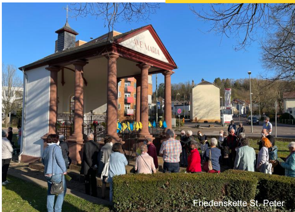
Friedenskette St. Peter

Falls es Ihnen möglich ist, bitten wir Sie auch weiter um finanzielle Unterstützung der Stiftung SEMPER FIDELIS, die direkt vor Ort mit konkreter Hilfe Menschen unterstützt: